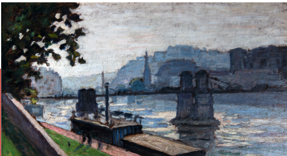
Albert André, La Saône à Lyon

Un hommage particulier sera rendu au cours de cette exposition au dernier représentant des Sanzistes encore présent et dont la reconnaissance internationale est établie depuis des décennies :