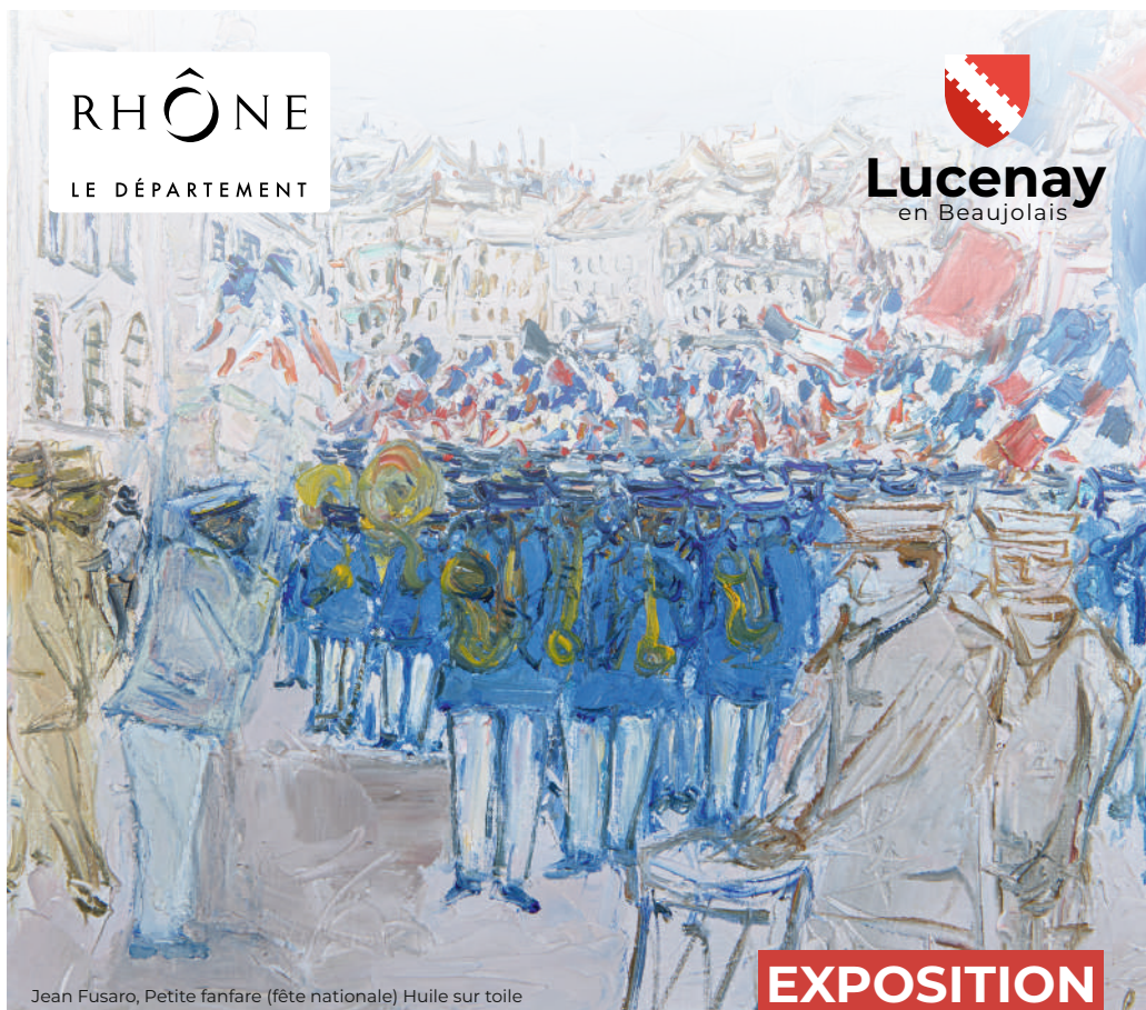
Jean Fusaro, Petite fanfare (fête nationale) Huile sur toile