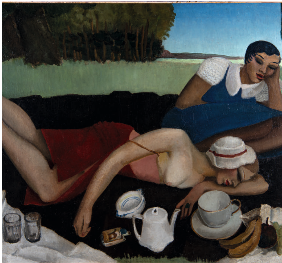
Pierre Pelloux, Le déjeuner sur l'herbe

Cette exposition de 150 tableaux se veut être un regard sur la peinture lyonnaise du XXème siècle. Elle n'a pu se réaliser que grâce à l'apport des collections du département du Rhône et d'une collection privée.